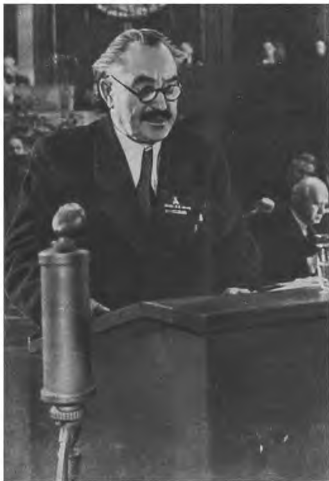
Г. Димитров выступает с заключительным словом на V съезде БКП. Декабрь 1948 года.