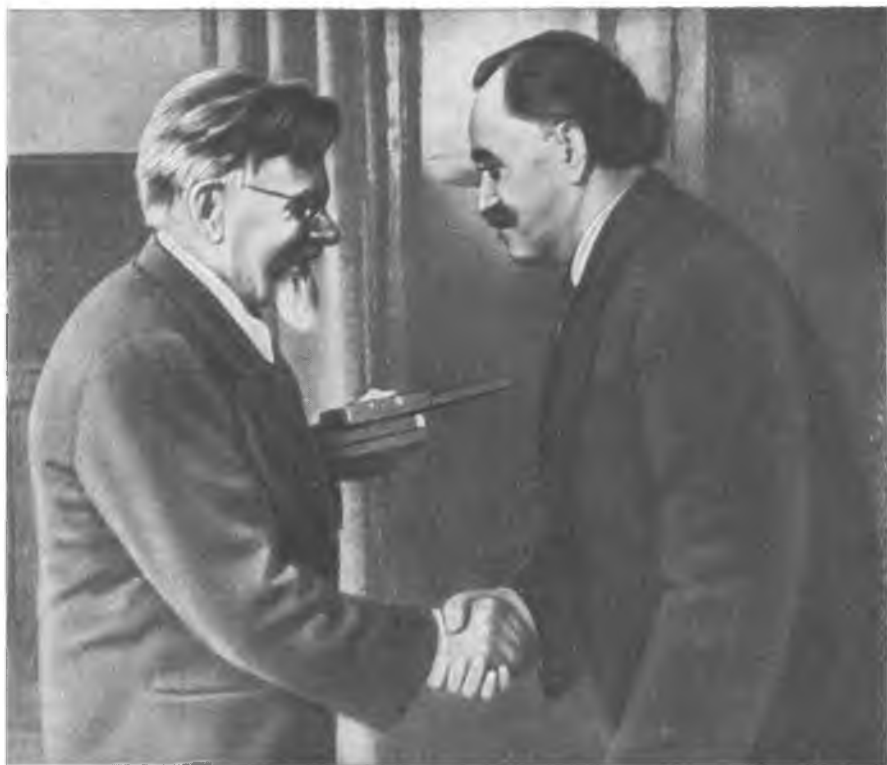
М. И. Калинин вручает Георгию Димитрову орден Ленина. Июнь, 1945 год.