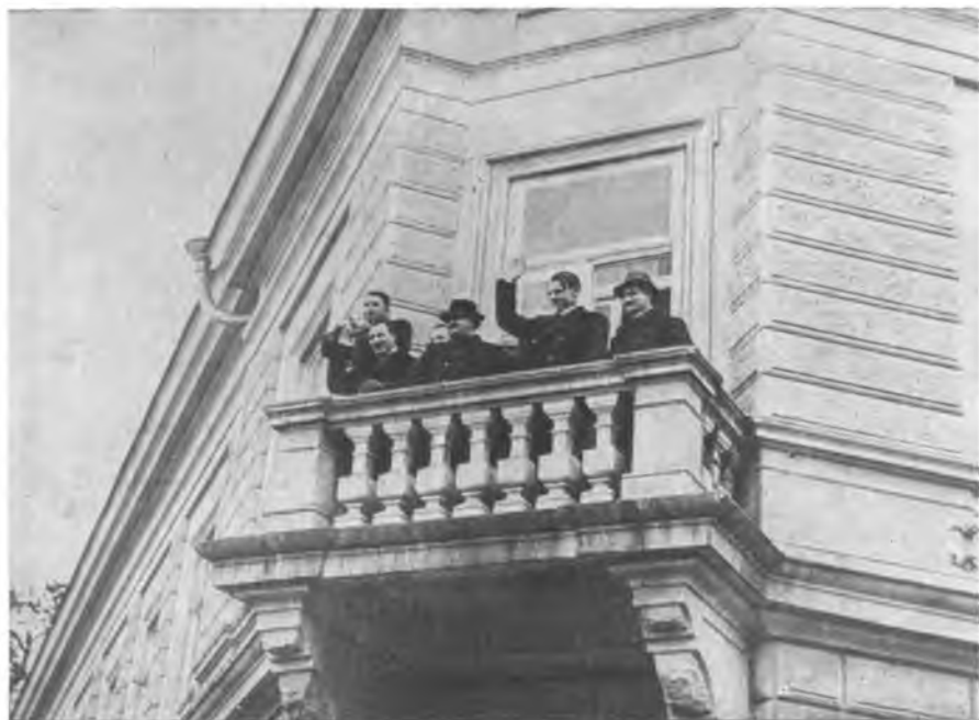
Димитров на балконе советского посольства в Болгарии в день демонстрации в годовщину освобождения Болгарии от турецкого ига. 3 марта 1945 года.