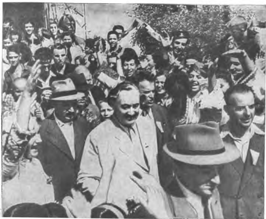
Георгий Димитров во время референдума, объявившего Болгарию Народной Республикой. 1946 год.