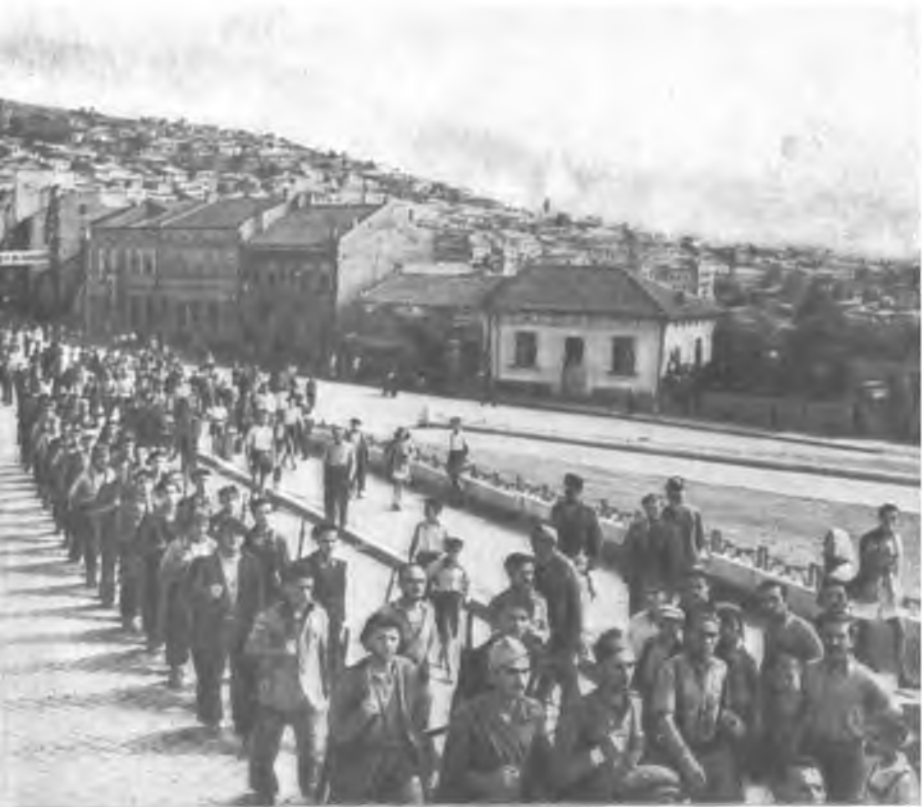
Партизаны входят в Тырново. Сентябрь 1944 года.

маршал Ф. И. Тол- ий 3-м Украинским которого вошли нтября 1944 года.