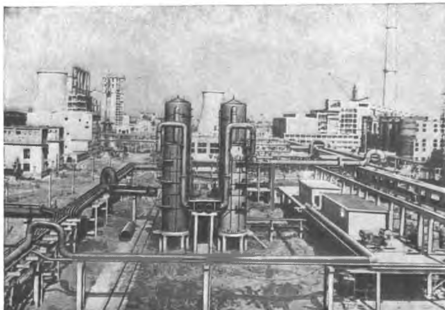
Строительство азотнотукового завода близ города Стара-Загора.