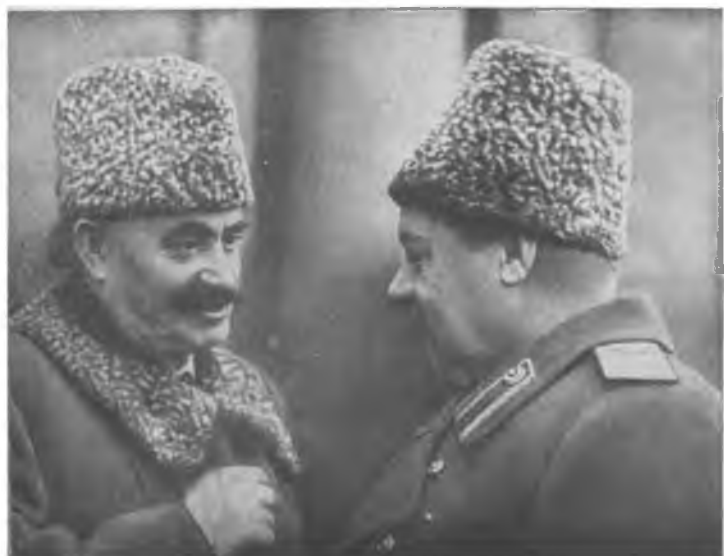
Г. Димитров и бухин. командую. фронтом, войска и Болгарию 8 сс