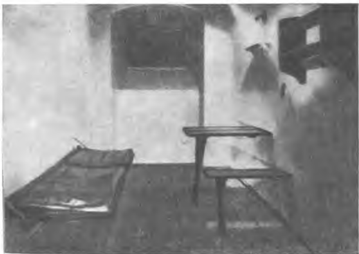
Камера в тюрьме Моабит, где Димитров находился с 28 марта по 17 сентября 1933 года.