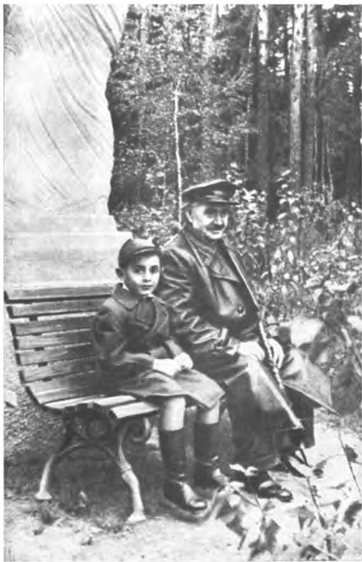
Георгий Димитров. 1948 год.