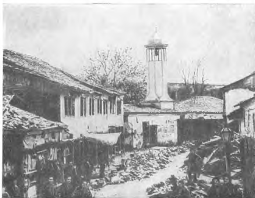
Старая София. Мясные ряды.