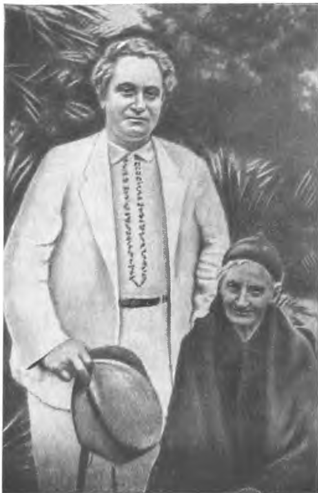
Георгий Димитров со своей матерью.