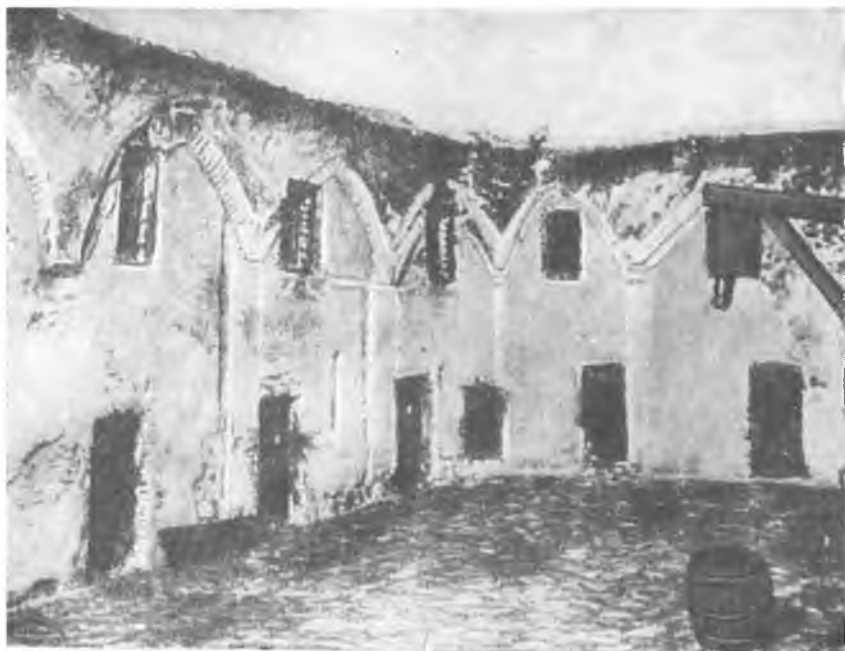
Тюрьма Черн я джамии.