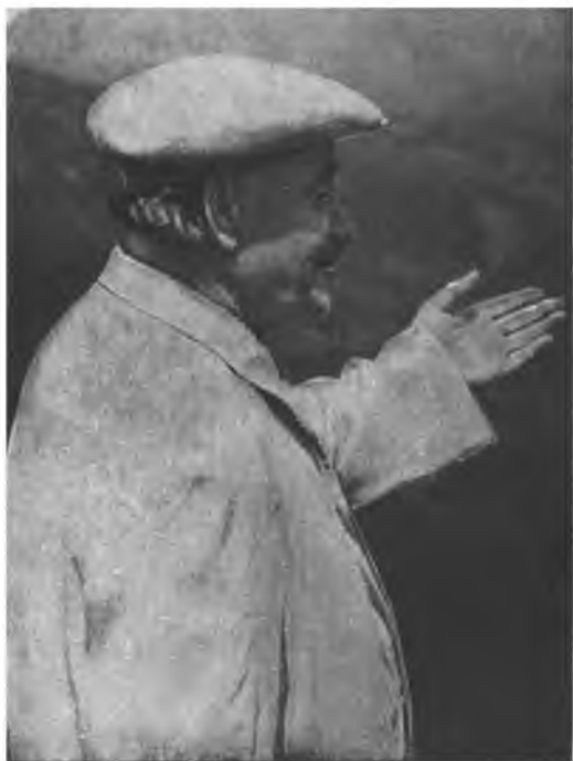
Георгий Димитров во время одного из своих выступлений в Болгарии.