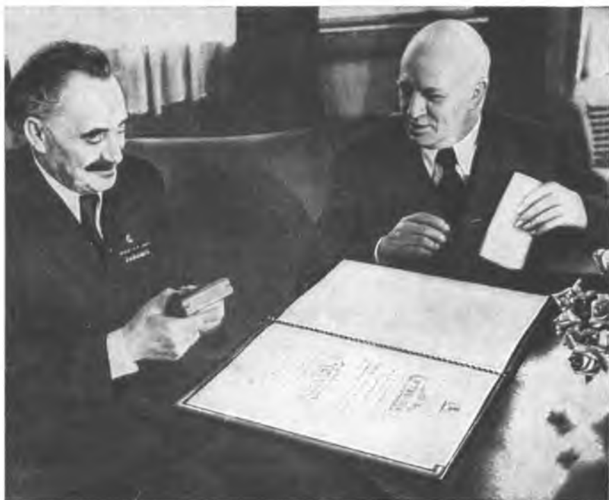
Г. Димитров и В. Коларов в день награждения Димитрова орденом Народной Республики Болгарии. 18 июля 1947 года.