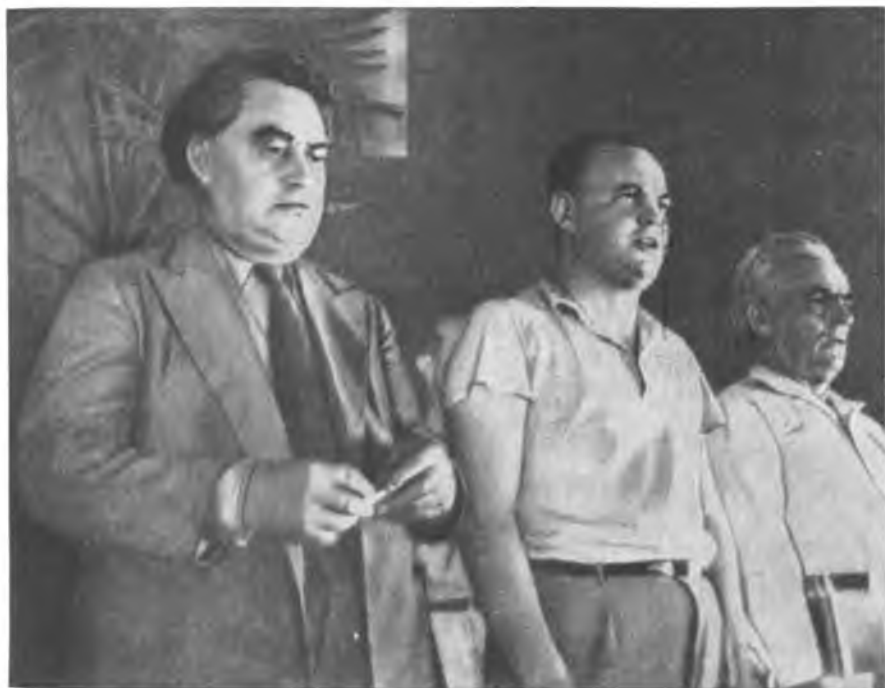
Г. Димитров, М. Торез и В. Пик на VII конгрессе Коминтерна. Август 1935 года.