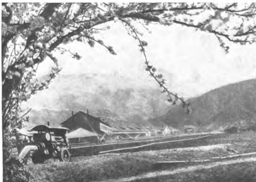
Лождевальная установка в ТКЗХ в селе Рила.