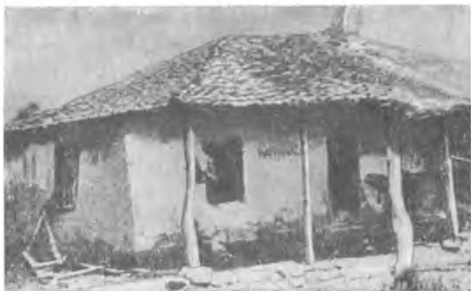
Дом в селе Ковачевци, где родился Георгий Димитров.