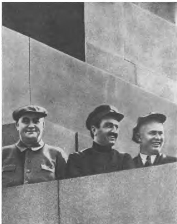
Г. М. Димитров, А. И. Микоян, Н. С. Хрущев на трибуне Мавзолея. 1 Мая 1934 года.