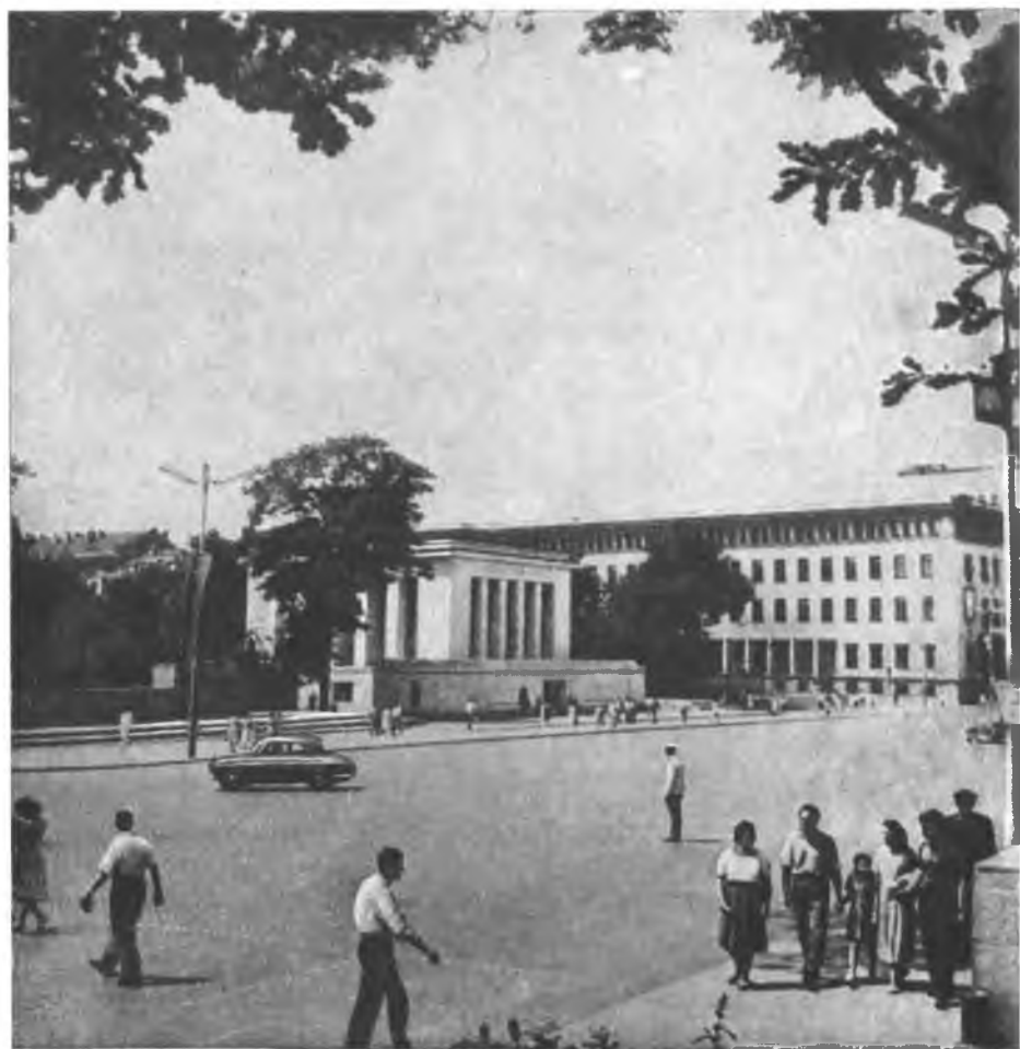
Площадь 9 сентября и Мавзолей Георгия Димитрова.