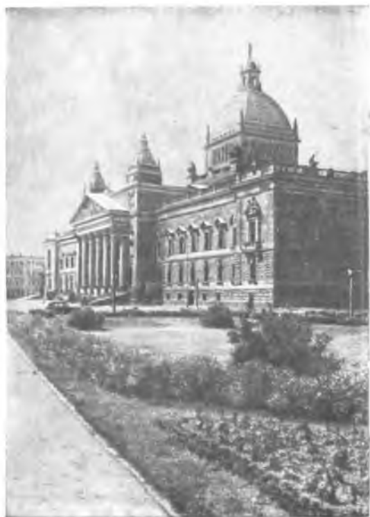
Здание имперского суда. Лейпциг.